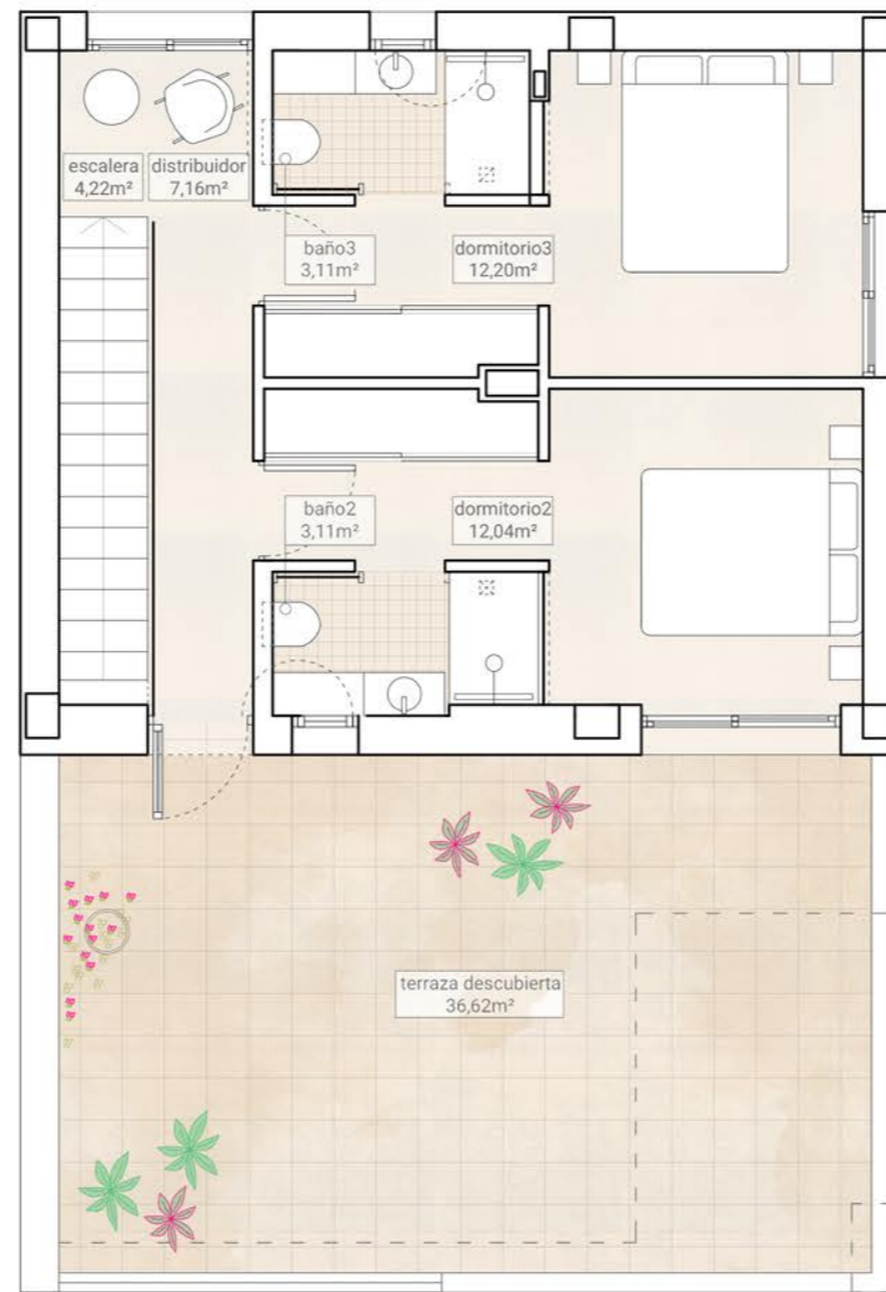
PLANTA PRIMERA/FIRST FLOOR Superficies útiles/Useful surfaces