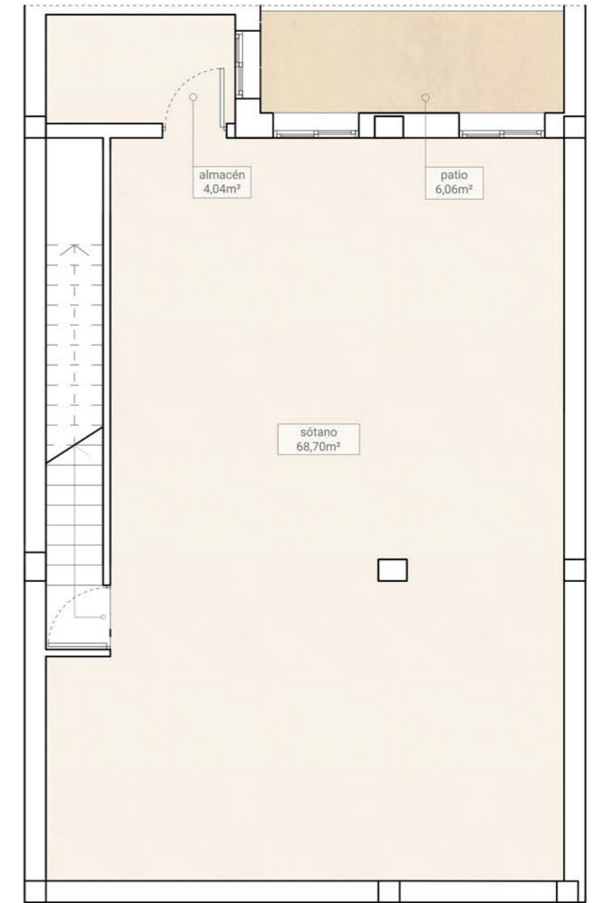
PLANTA SÓTANO/BASEMENT Superficies/Surfaces